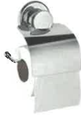
Metal Tuvalet Kağıtlığı